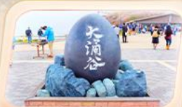
ซุบเขาไฟดำโอวาคุดานิ