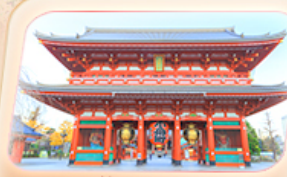
วัดฮาซากุสะ