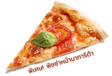
พิเศษ! พิซซ่าหน้ามาการิต้า

(ชื่อโรงแรมที่ท่านพัก ทางบริษัทจะทำการแจ้งพร้อมใบนัดหมาย 5-7 วันก่อนวันเดินทาง)