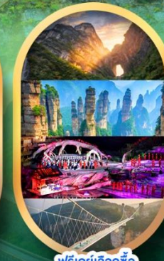
ฟรีเคย์เลือกซื้อ Option เสริม