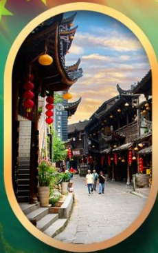
เมืองโบราณฟูหยงเจิ้น