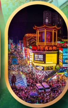
ถนนคนเดินชิงหลู่