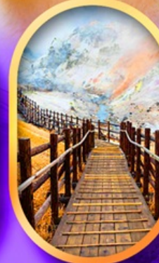
จิกุคคาบิ