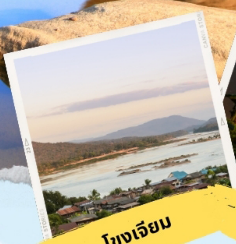
โขงเจียม

ชุมชนบ้านปะอ่าว ,วัดหนองบัว ,วัดสระประสานสุข ชมพระ อุโบสถที่เป็นรูปเรือสุพรรณหงส์ ล่องเรือชมแม่น้ำสองสี ,สามพันโบก ,วัดสิรินธรวรารามภูพร้าว วัดเรืองแสง ,อุทยานแห่งชาติผาแต้ม ชม ภาพเขียนสีก่อน ประวัติศาสตร์ มีอายุประมาณ 3,000 - 4,000 ,แก่งตะนะ