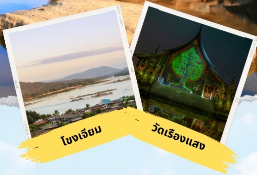
โขงเจียม