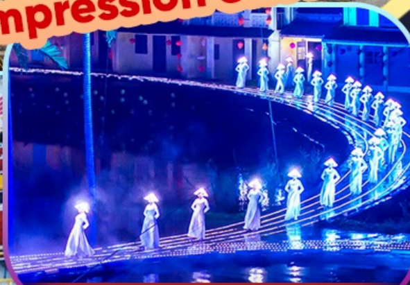
Hoi An Impression Show