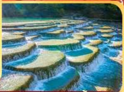
หุบเขาพระจันทร์สีน้ำเงิน