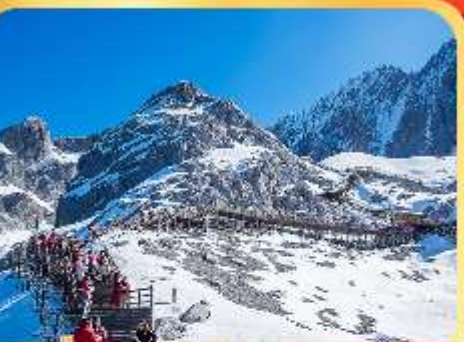
ภูเขาหิมะมังกรหยก