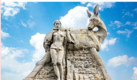
อนุสาวรีย์กว้างเหลี่ยมหลัง