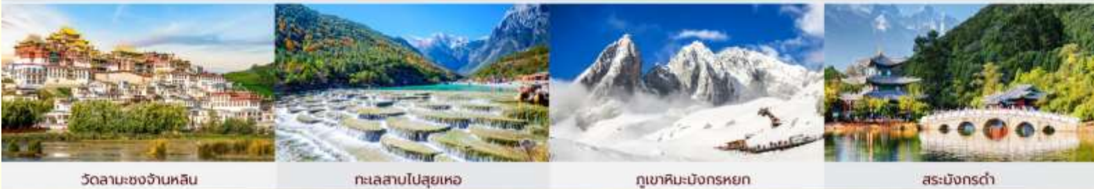
วัดลามะชงจันหลิน