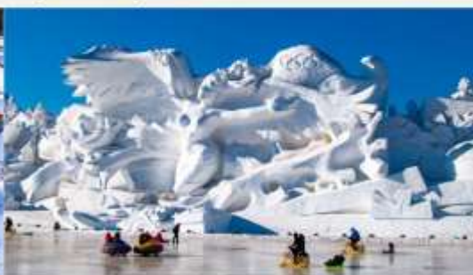
เกาะพระอาทิตย์