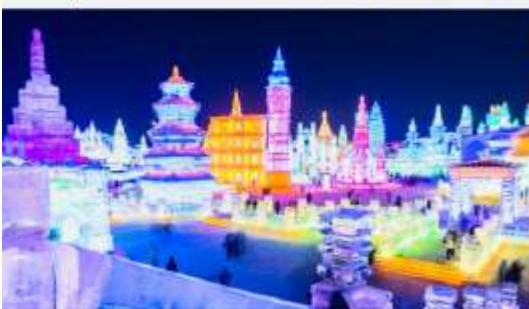
เทศกาลคอมไฟน้ำแข็ง