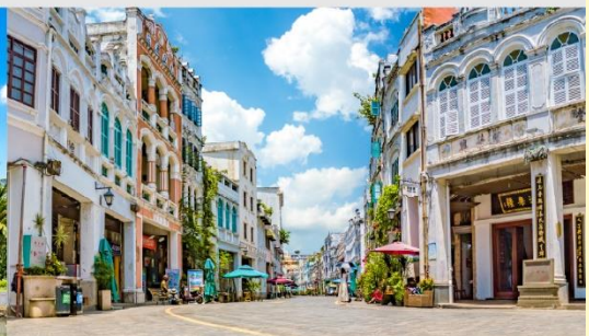
ถนนโบราณฉีไหลว