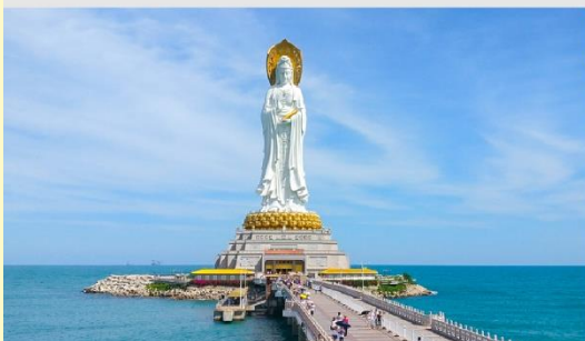
เจ้าแม่กวนอิมหนานชาน