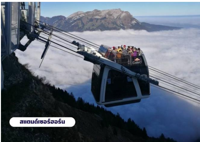
สแตนดเซอร์ฮอร์น

📍 บริการอาหารเช้า ณ ห้องอาหารของโรงแรม จากนั้นนำท่านเดินทางสู่สถานีกระเช้า เพื่อเตรียมตัวเดินทางขึ้นสู่ ยอดเขาสแตนเซอร์ฮอร์น (Mt.Stanserhorn) มีความสูงที่ 1,898 เมตร(6,227 ฟุต) ระหว่างทางคุณจะได้ชมวิวแบบพาโนรามาและให้ท่านได้สัมผัสการเดินทางโดยขึ้นกระเช้า “Cabrio” กระเช้าลอยฟ้าเปิดประทุนที่มี 2 ชั้นแห่งแรกของโลก และสามารถจุผู้โดยสารได้เกือบ 60 ท่าน โดยขึ้นดาดฟ้าจะสามารถจุได้ 30 ท่าน ระยะเกือบ 2 กิโลเมตร ระหว่างทางขึ้นสู่ยอดเขาท่านจะสามารถมองเห็นวิวแบบ 360 องศา จากนั้นให้ท่านได้เพลิดเพลินกับความสวยงามของธรรมชาติและทัศนียภาพที่งดงาม