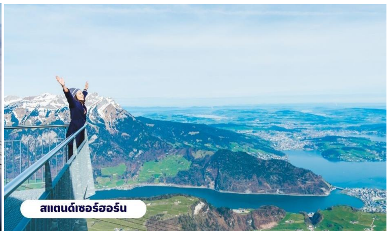
สแตนดเซอร์ฮอร์น