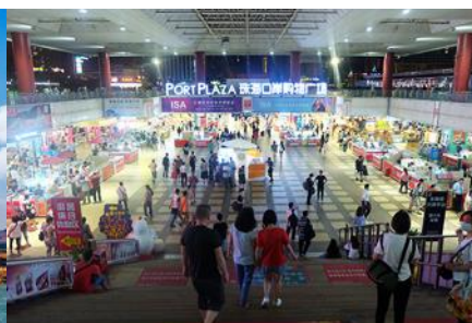
ตลาดใต้ดินกวางเป่