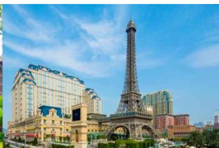
The Parisian Macao