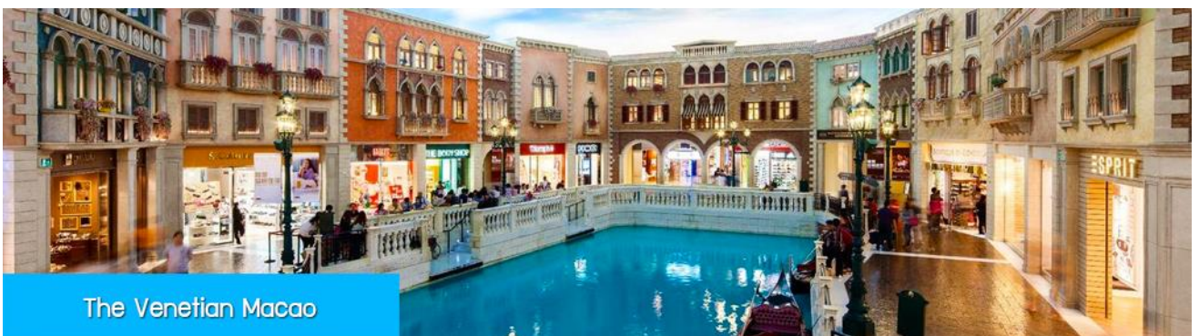
The Venetian Macao

จากนั้นนำท่านผ่านด่านกักเปย์เพื่อเดินทางสู่ เมืองมาเก๊า 澳門 เขตปกครองพิเศษที่ ๆ อยู่ใต้สุดของจีน ที่ได้ชื่อว่าเป็น ลาสเวกัสของเอเชีย แหล่งรวมสถานบันเทิง คาสิโน โรงแรม รีสอร์ท และร้านจำหน่ายสินค้าแบรนด์เนมชั้นนำจากทั่วโลก อีกทั้งยังเป็นเมืองท่องเที่ยวยอดนิยมที่นักท่องเที่ยวทั่วโลกเดินทางมาเยือนปีละ 30 ล้านคน.....ถึงมาเก๊านำท่าน