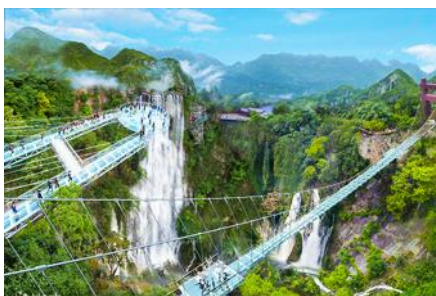
อุทยานกุหลองเสี

คณะพร้อมกัน ณ ท่าอากาศยานสุวรรณภูมิ อาคารผู้โดยสารขาออก ชั้น 4 ประตู 10 เคาน์เตอร์สายการบิน 9AIR พบเจ้าหน้าที่บริษัทฯ คอยให้การต้อนรับและอำนวยความสะดวกด้านเอกสารและสัมภาระก่อนการเดินทาง