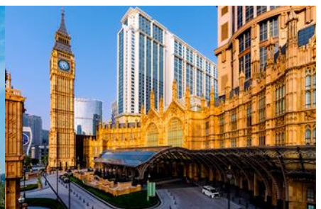
The Londoner Macao