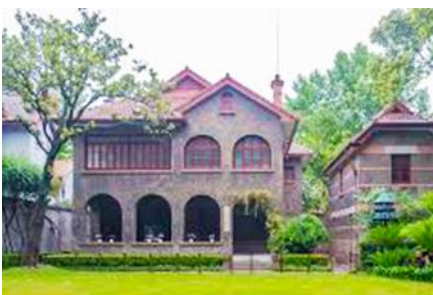
บ้านเกิดซุนยัตเซน

พักที่ IRVINE HOLIDAY HTL OR HUICHANG HTL 3* หรือโรงแรมในระดับเดียวกันในเมืองจูไห่