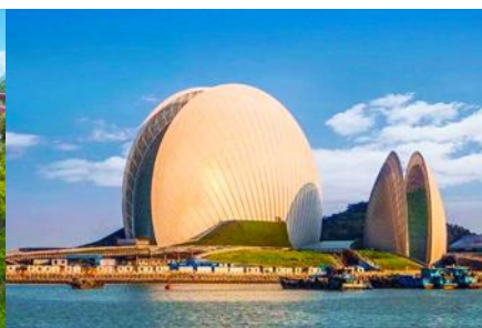
โรงละครจูไห่