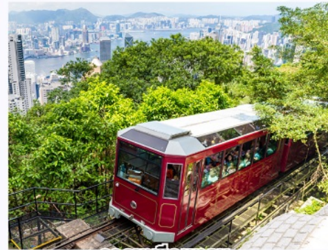
รางฟิคแถม