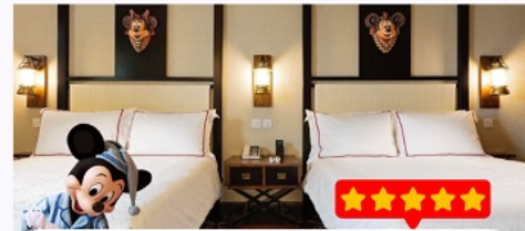
พัก Disney Explorers Lodge 5 ดาว 1 คืน