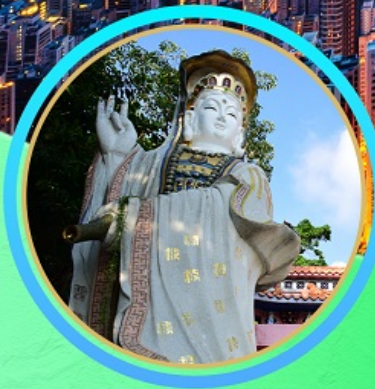
เจ้าแม่กวนอิมริมทะเล