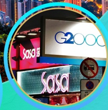
อิสระช้อปปิ้ง