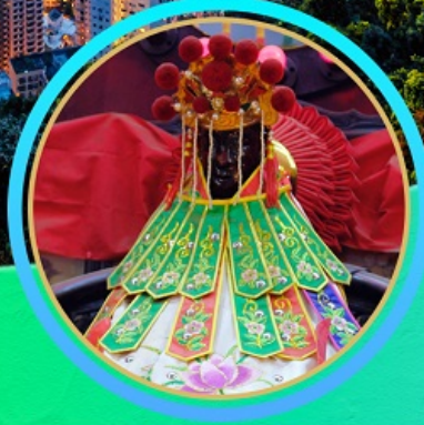
เจ้าแม่กวนอิมสองฮัม