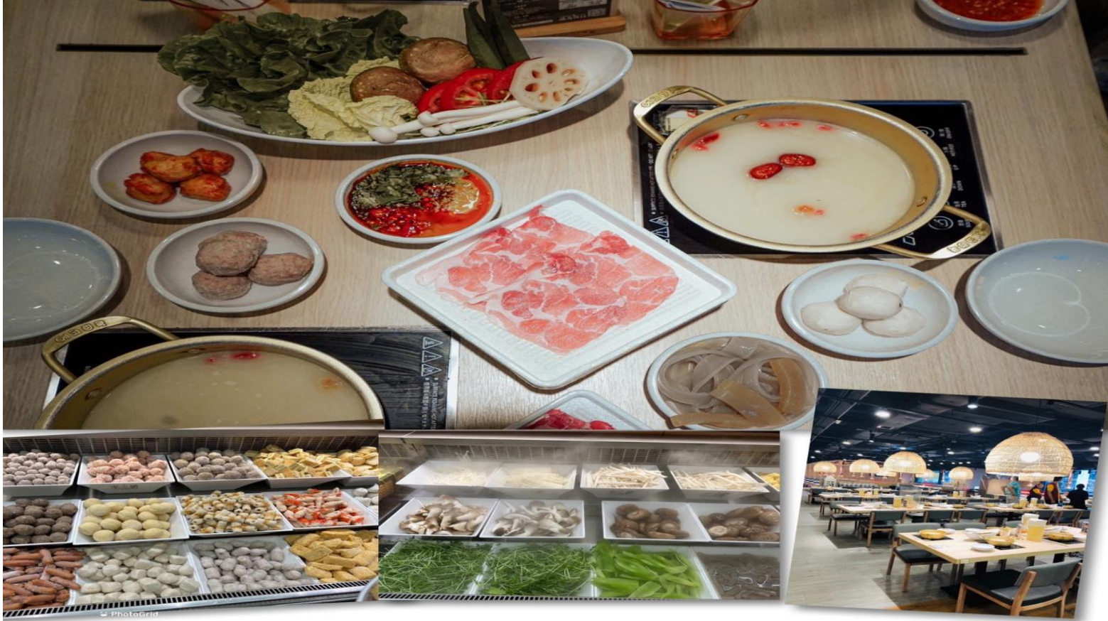
เที่ยง รับประทานอาหารเที่ยง ๑๐ (3) เมนูชาบู