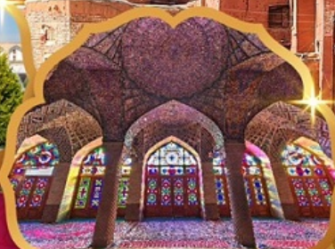
Nasir al Molk Mosque