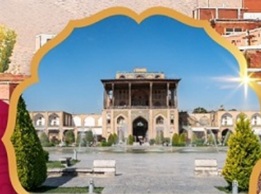
Ali Qapu Palace