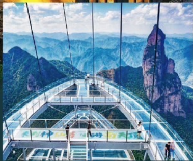
สะพานกระจกจาก แคนยอนหวางมระดับชาติ

ไม่เข้าร้านรัฐบาล ราคาพิเศษเพียง 29,900.-