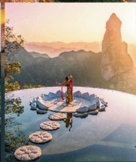
ยอดเขาเจ้าแม่กวนอิมอันศักดิ์สิทธิ์