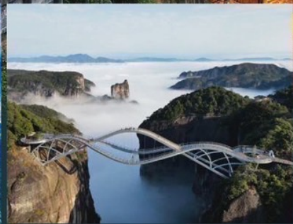
สะพานกระจกข้ามภูเขาสุดอลังการ