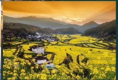
หมู่บ้านโบราณทวงหลิง หนึ่งในหมู่บ้านที่สวยงามที่สุดในจีน