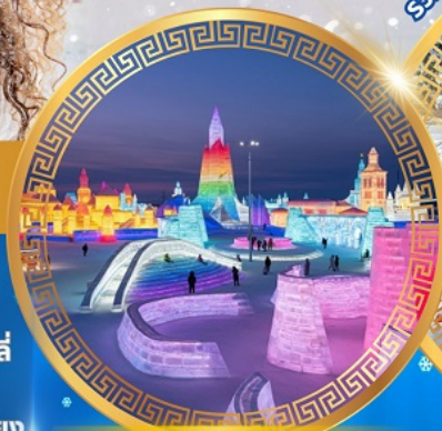
เทศกาลแกะสลักน้ำแข็ง

จตุรัสโบสถ์เซินโซเฟีย ถนนจงหยาง หมู่บ้านหิมะดินแดนมหัศจรรย์ อนุสาวรีย์ฝังหกง สนุกสนานกับลานสกียาปูลี่ ถนนแฉ่ยูนเจีย เขาแกะหลัว เขาปังจวู ภาพเขียน Ice and Snow แม่น้ำซงฮัวเจียง โซ่วว้ายน้ำแข็ง เกาะพระอาทิตย์