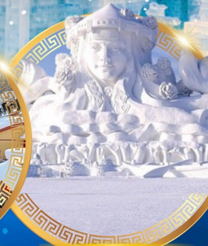
เกาะพระอาทิตย์