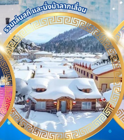
หมู่บ้านหิมะ Dream Home