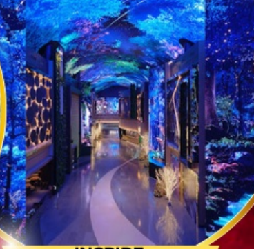
คาเฟ่ดัง Forest Outing