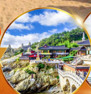
วัดแฮดยงกุงซา