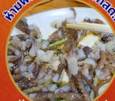
ชั้นนักชี อาหารท้องถิ่น