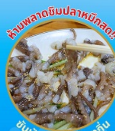
ห้ามพลาดชิมปลาหมึกสด!!

ถ่ายรูปชิคๆ หมู่บ้านวัฒนธรรมคิมซอน ใหม่ล่าสุด คาเฟ่ริมทะเล วิวหลักล้าน ขึ้นเคเบิลคาร์ ชมทะเลปูซาน ห้ามพลาด!! ตลาดปลาที่ใหญ่ที่สุด ชิมของอร่อยที่ตลาดแฮนแด ช้อปปิ้งตลาดพื้นเมือง แหล่งช้อปปิ้งใต้ดิน ซัมซอน อิสระช้อปปิ้ง Lotte Duty Free