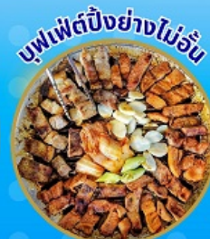
บุฟเฟ่ต์ปิ้งย่างไม่อื่น