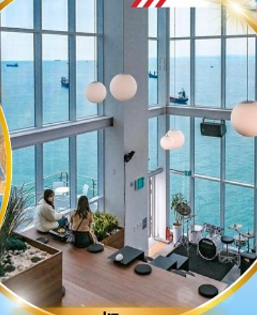
คาเฟ่วิวทะเล

ถ่ายรูปชิคๆ หมู่บ้านวัฒนธรรมคิมซอน ใหม่ล่าสุด คาเฟ่ริมทะเล วิวหลักล้าน ขึ้นเคเบิลคาร์ ชมทะเลปูซาน ห้ามพลาด!! ตลาดปลาที่ใหญ่ที่สุด ชิมของอร่อยที่ตลาดแฮนแด ช้อปปิ้งตลาดพื้นเมือง แหล่งช้อปปิ้งใต้ดิน ซัมซอน อิสระช้อปปิ้ง Lotte Duty Free