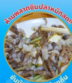
ซีมงออร์อย อาหารท้องถิ่น

ถ่ายรูปชิคๆ หมู่บ้านวัฒนธรรมคิมซอน ใหม่ล่าสุด คาเฟ่ริมทะเล วิวหลักล้าน ซินเดอเรลล่า ชมทะเลปูซาน ห้ามพลาด!! ตลาดปลาที่ใหญ่ที่สุด ซีมงออร์อยที่ตลาดแฮอนแด ช้อปปิ้งตลาดพื้นเมือง แหล่งช้อปปิ้งใต้ดิน ซึมซอน อิสระช้อปปิ้ง Lotte Duty Free