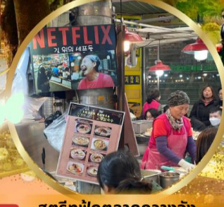
สตรีทฟู้ดตลาดกวางจ้ง