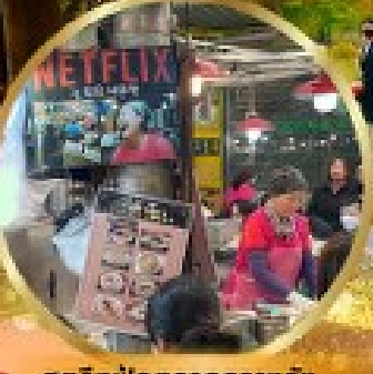
สตรีทฟู้ดตลาดกวางจิง