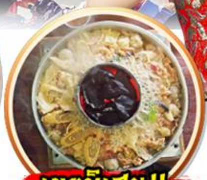
เมฆหมอกพิเศษ!!