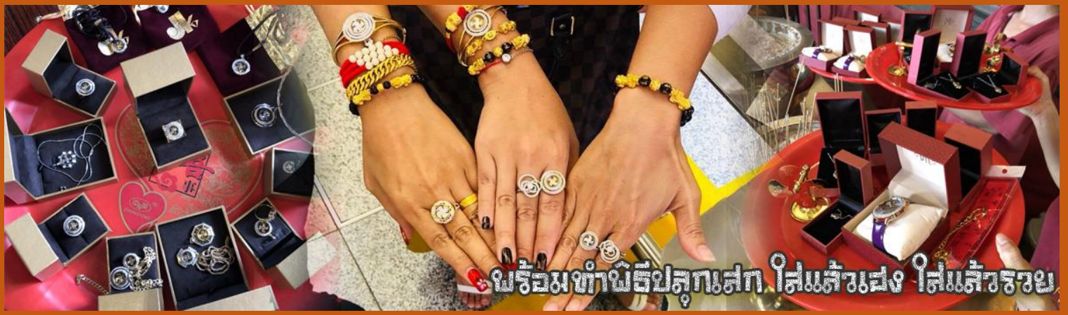
มาร่วมทำพิธีปลุกเสก ใส่แล้วเฟื่อง ใส่แล้วรวย

นำท่านเยี่ยมชม โรงงานจิวเวลรี่ ที่ขึ้นชื่อของฮ่องกงพบกับงานดีไซน์ที่ได้รับรางวัลอันดับยอดเยี่ยม และใช้ในการเสริมดวงเรื่อง ฮวงจุ้ยนำความโชคดี มั่งมั่งแก่ผู้สวมใส่ ซึ่งในเมืองไทยก็ได้นิยมแพร่หลายออกไป ไม่กว่าจะเป็นกลุ่ม ดารา นักการเมือง พ่อค้าแม่ขายที่ประกอบธุรกิจ เจ้าของกิจการห้างร้านต่างๆ ซึ่งเชื่อกันว่าจะนำสิ่งดี ๆ บัดเป่าสิ่งชั่วร้ายให้กับบุคคลที่สวมใส่ ซึ่งจะมีมากมายหลายชนิด เช่นจี้กั๊กัน แหวนรุ่งต่าง ๆ นาฬิกาข้อมือ (ซึ่งผู้สวมใส่จะได้รับการดูอายุมือจากซินแซประจำร้าน เพื่อนำวิธีการเสริมดวงในการสวมใส่โดยไม่ติดค่าบริการ)