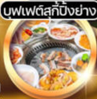
บุฟเฟ่ต์สุกี้ปิ้งย่าง