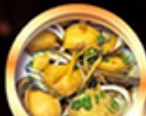
เมนูซีฟู้ดสัญจร