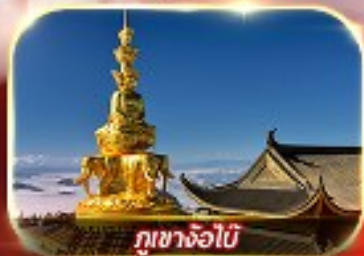
กุเขาจ้อไบ๊