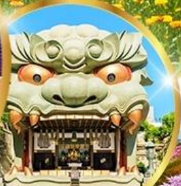
ศาลเจ้านิมมะ ยาชากะ