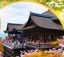
วัดคิโยมิจิ