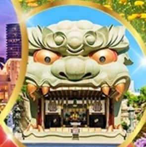
ศาลเจ้านัมบะ ยาชากะ