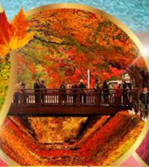
อุโมงค์เมเปิ้ล