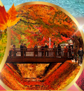
อุโมงค์เมเปิ้ล