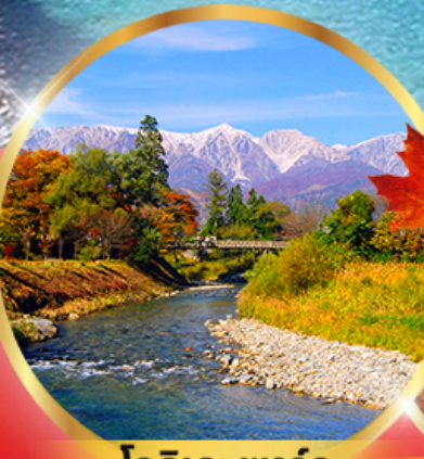
โออิตะ พาร์ค