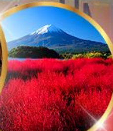
โออิชิ พาร์ค