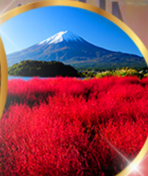
โออิชิ พาร์ค