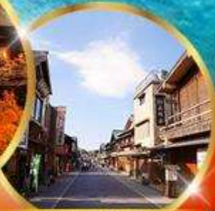
ถนนคนเดินฮิโระ