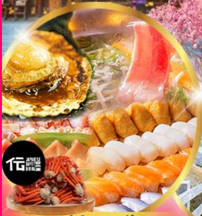
บุฟเฟ่ต์ซาปู + ซิฟุด อาหาร มากกว่า 50 เมนู