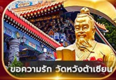
ขอความรัก วัดหวังต้าเซียน