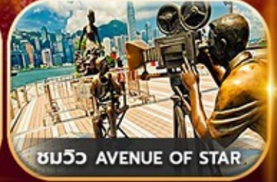
ชมวิว AVENUE OF STAR