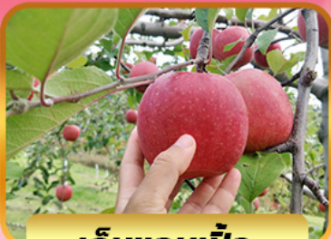
เก็บแอปเปิ้ล

Exclusive PRODUCT *วันนมินทรมหาราช 10 - 16 ตุลาคม 2567 17 - 23 ตุลาคม 2567 *วันหยุดปิยมหาราช