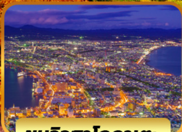
ชมวิวฮาโกดาเตะ