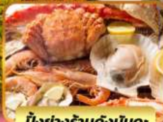
บั้งย่างร้านดังนั้นตะ