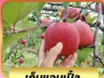
เก็บแอบเปิ้ล