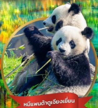
หมีแพนด้ายักษ์เจียงเยี่ยน