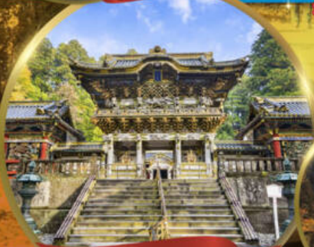
ศาลเจ้ามิกโกโทโซกุ