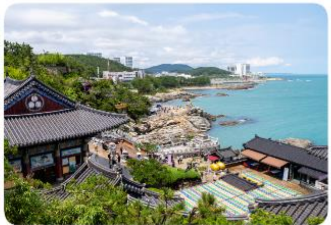
ถ่ายรูป และดื่มด่ำกับความงามยิ่งนัก

วัดแฮดงกุงซา วัดพุทธเก่าแก่ของปูซาน วัดสร้างอยู่บนโขดหินริมชายหาด ก่อตั้งโดยพระผู้ยิ่งใหญ่ชื่อว่า พระนางชูโดซา ตั้งแต่ ค.ศ. 1376 และได้รับบูรณะครั้งใหญ่ในปี ค.ศ. 1970 ตัววัดหันหน้าออกทางทิศตะวันออก จึงทำให้เป็นจุดชมพระอาทิตย์ขึ้นที่สวยงามที่สุดแห่งหนึ่งของปูซาน ในบริเวณวัดมีเจดีย์สามชั้นในศิลปะแบบเกาหลี และสิงโตสี่ตัว ซึ่งแต่ละตัวถือเป็นสัญลักษณ์แห่งความยินดี ความโกรธ ความเศร้า และความสุข