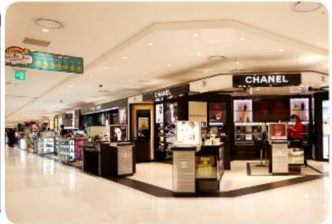
ทัศนียภาพโดยรอบ

LOTTE DUTY FREE BUSAN ศูนย์รวมสินค้าปลอดภาษีที่ใหญ่ และดีที่สุดในเมืองปูซาน ที่รวบรวมสินค้าแบรนด์เนมของทั้งจากเกาหลี และจากทั่วทุกมุมโลกกว่า 200 แบรินด์ มารวมไว้เพื่อให้ทุกท่านได้เลือกซื้อในราคาสุดพิเศษที่ปลอดภาษี ทั้งยังมีของขวัญ ของที่ระลึกพิเศษต่าง ๆ ของเกาหลีมีไว้จำหน่ายเป็นของฝากในการมาเยือนเกาหลีอีกด้วย