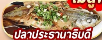
ปลาประธาราธิบดี