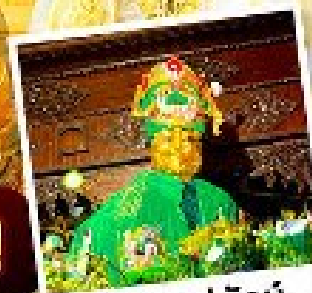
ซอพรแม่ยักย์