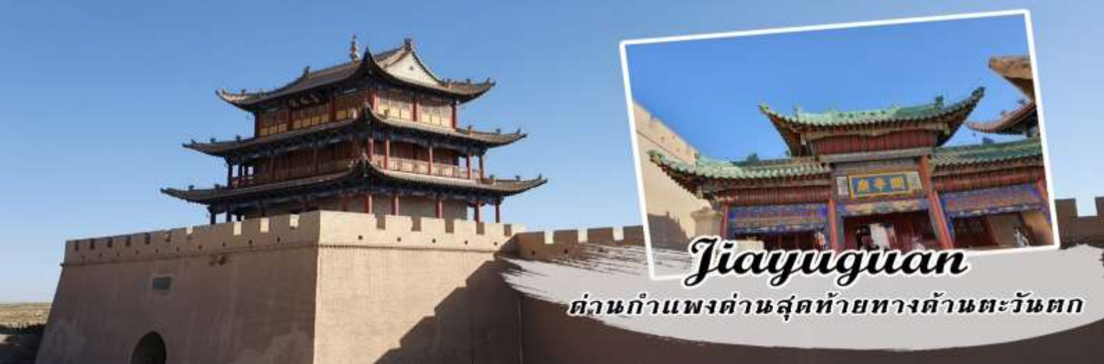
Jiayuguan ด่านกำแพงด่านสุดท้ายทางด้านตะวันตก

นำท่านชม ด่านเจียหยี่กวน เป็นด่านสุดท้ายของกำแพงเมืองจีนทางด้านตะวันตก เป็นจุดเริ่มต้นของกำแพงเมืองจีนที่ทอดยาวถึงด้านชั้นให้กวนทางภาคอีสานของจีน ชมปรากฏการสูง 773 เมตรเหนือระดับน้ำทะเล กำแพงสูง 10 เมตร ยาว 640 เมตร เป็นที่ตั้งของหอรบวังภัย ด้านหนึ่งทอดไปทางด้านตะวันตกเฉียงใต้สู่เทือกเขาฉีเหลียนซาน อีกด้านหนึ่งทอดไปทางทิศเหนือสู่เทือกเขาเป่ยกาน