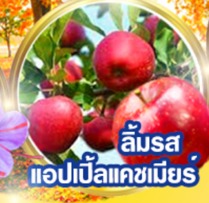
ลิ้มรส แอปเปิ้ลแคชเมียร์