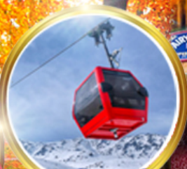
กระเช้ากุลมาร์ค ชมวิวยุคอลังการ