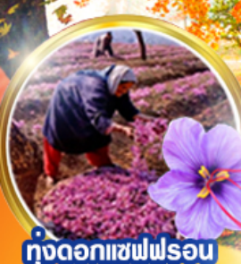
ทุ่งดอกแซฟฟรอน