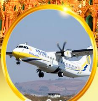
บินภายใน 1 ชม