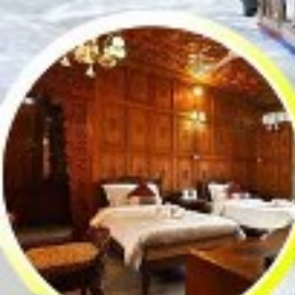
บ้านเรือ..วิมานบนดิน