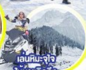
เล่นหิมะ-จ๊ว ให้หายคิดถึง