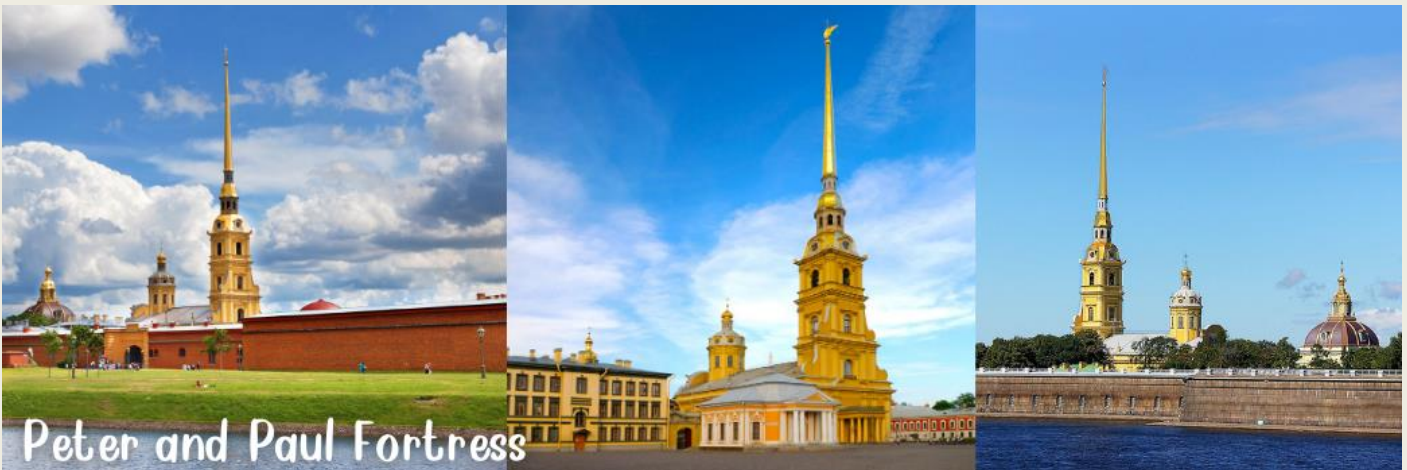
Peter and Paul Fortress

กลางวัน 📍 รับประทานอาหาร ณ ภัตตาคารท้องถิ่น นำท่านชม บ้อมปีเตอร์ แอนด์ ปอลด์ (Peter And Paul) เป็นสิ่งก่อสร้างแรกสุดของเมือง St Petersburg สร้างในปีค.ศ 1703 เป็นอนุสรณ์ชัยชนะสงครามเหนือสวีเดน ด้วยศิลปะแบบบารอกเพื่อใช้เป็นบ้อมปราการในการป้องกันข้าศึกกรุกราน ตั้งอยู่บน เกาะวาซิลเยฟสกี (Vasilievsky Island) ลักษณะเป็นรูปทรงหกเหลี่ยม กำแพงเป็นหินก่ออิฐ ส่วนวิหารปีเตอร์ แอนด์ ปอลด์ (Peter-and-Paul-Fortress) เริ่มสร้างขึ้นเมื่อปีค.ศ 1712 ด้วยการ ออกแบบของ DomennicaTrezzini สร้างเสร็จในวันที่ 29 มิถุนายน ค.ศ 1733 ตั้งชื่อวิหารแห่งนี้เพื่อเป็นเกียรติแด่นักบุญปีเตอร์ และนักบุญปอลด์เพื่อเป็นการเผยแพร่ศาสนา ความสูงของยอดแหลมคือ 122.5 เมตร ในอดีตเป็นสิ่ง ก่อสร้างที่สูงที่สุดของเมืองและห้ามสร้างสิ่งก่อสร้างใดสูงกว่า ภายในทำการตกแต่งด้วยศิลปะบารอกซึ่งนับว่าแตกต่าง กับโบสถ์คริสต์ออร์ทอดอกซ์ทั่วไปและวิหารแห่งนี้ยังเป็นที่เก็บพระศพของราชวงศ์โรมานอฟ เริ่มต้นจากพระเจ้าปีเตอร์มหาราชเป็นองค์แรก จนกระทั่งถึงกษัตริย์องค์สุดท้ายของราชวงศ์