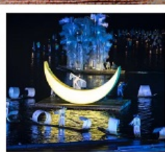
โซ่วหลิวชานเจีย