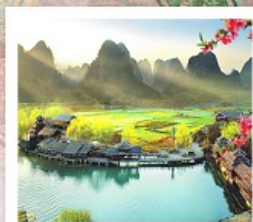
เมืองลิบไถ