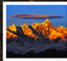
เขานานเจินปาหว่า