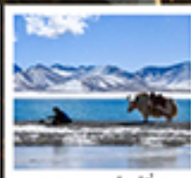
ทะเลสาบน้ำมูเซวี่