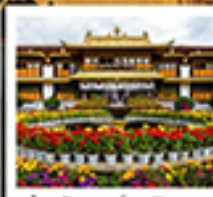
ตำหนักนอร์บูหลินบา

เขาวัวยอดเขานานเจินปาหว่า / จุดชมวิวทะเลสาบลูกลาง / อุทยานเขามินยี / รมีเยงกรจก / วัดลามะ พระราชวังโปตาลา / วัดโจคัง / ถนนเปดหลี่ยม / ทะเลสาบน้ำมูเซวี่ / ตำหนักนอร์บูหลินบา / เมืองโบราณลั่วไต