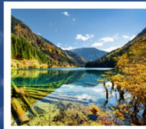
จิวจ้ายโกว

อุทยานภูเขาสี่ดรุณี / อุทยานชวงเฉียวโกว / ทะเลสาบเตี้ยซีไห่ / อุทยานแห่งชาติจิวจ้ายโกว โชว์ทิเบต / เมืองโบราณซงพาน / ซอยกว้างแคบ / POP MART / ถนนคนเดินซวยกวางแคบ