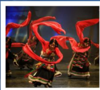
โชว์ทิเบต