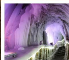
ถ้ำน้ำแข็งหมื่นปี