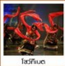
โซ่วทึนเจ